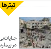
جنایات بی پایان صهیونیست ها در بیمارستان شفا